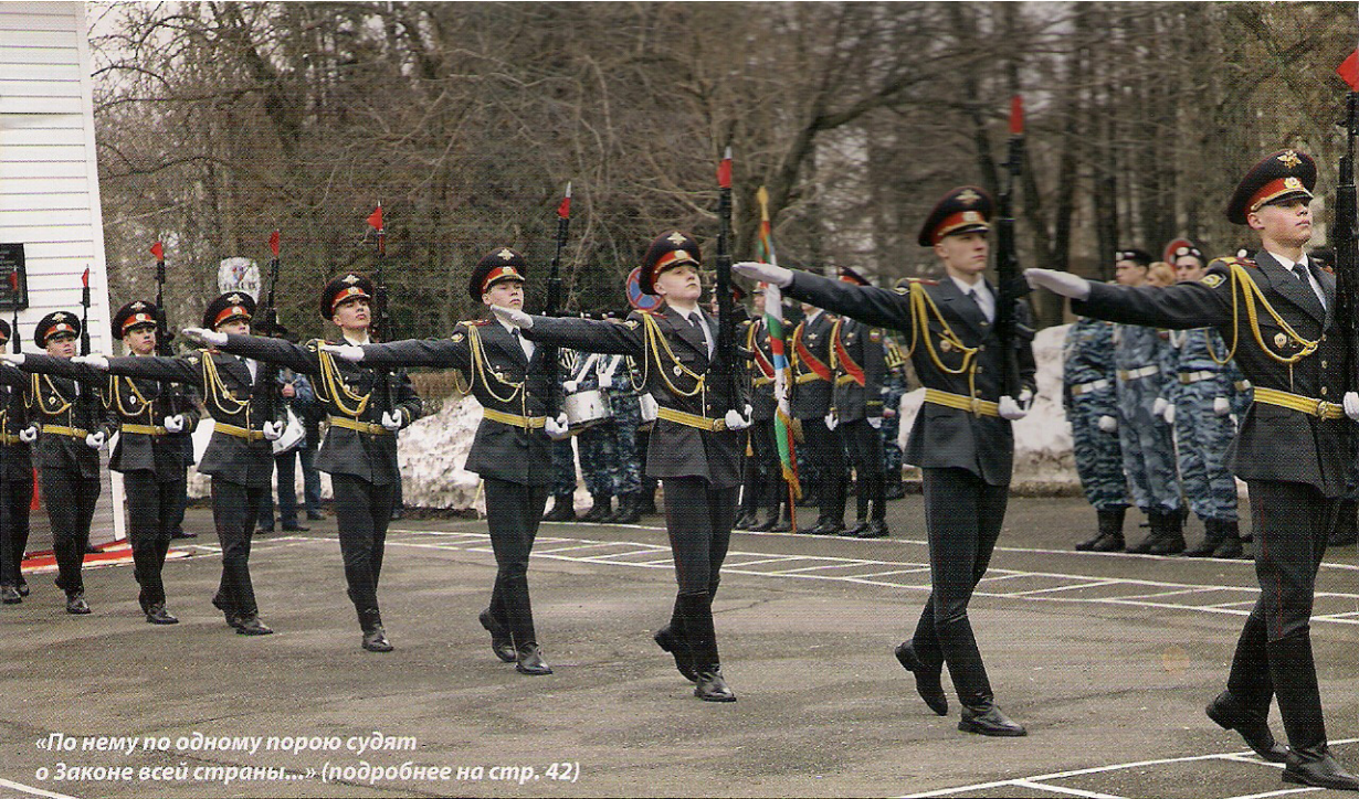
«По нему по одному порою судят о Законе всей страны...» (подробнее на стр. 42)